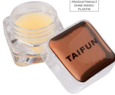
Lipcare Cube Digital Print