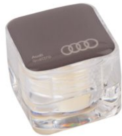
Lipcare Cube Doming